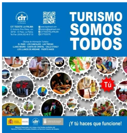
Turismo Somos Todos III