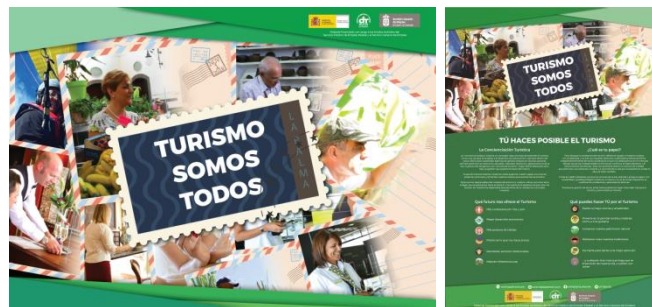
Cartel y póster promocional

Para las acciones con los colectivos se elaboraron folletos personalizados con ideas claras y concisas sobre lo que pretendemos, lo que supone el turismo para cada colectivo y la necesidad de tenerlo en consideración como un elemento diversificador de empleo y de la economía.