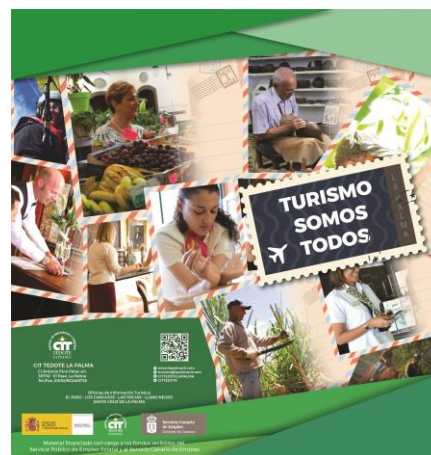
Turismo Somos Todos IV